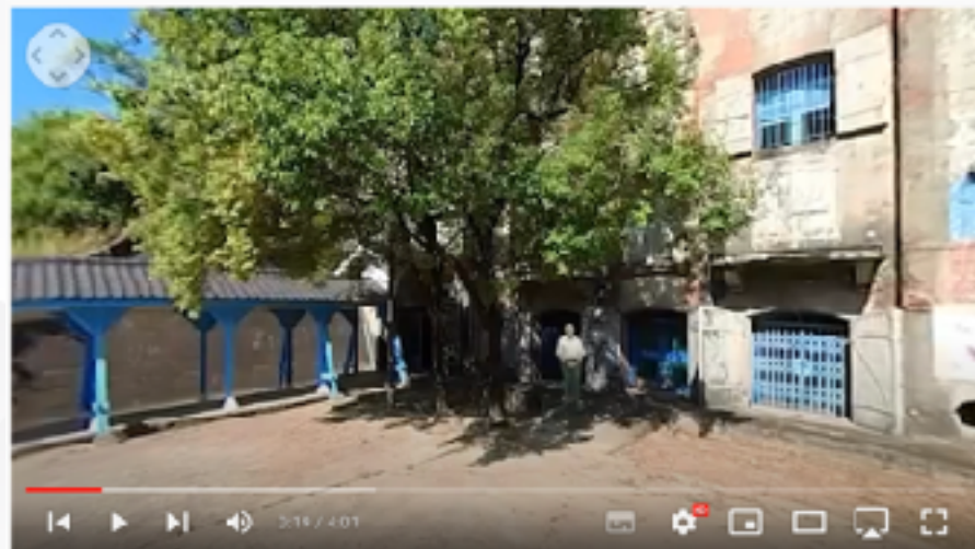
鳳山招待所大碉堡山洞-毛扶正篇(360 VR)