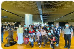
校外參訪-南市圖合照

以「培養具有社會關懷與法學觀之圖資人」為指導原則。本課程主在提供圖書館從業人員法務相關所需之基礎知識，訓練法學邏輯思考的能力，期達致以融會貫通之智慧解決各種繁雜法律問題的目標。