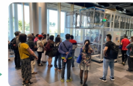
校外參訪-參觀自動還書機

掌握閱讀行為趨勢與轉變，熟悉閱讀推廣活動的規劃與設計，藉以創意推展各類閱讀活動。