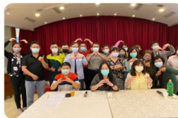
校外參訪-研討會合照