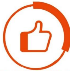
生活助學金 每月 6,000 元