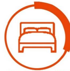
免費住宿 免費宿舍