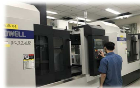
電腦數值控制機具實習