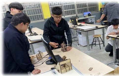
機構設計加工實習