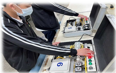
工業配線丙級實作