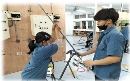
室內配線丙級實作