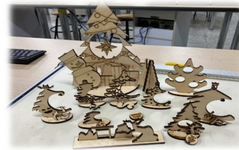
學生雷射切割作品