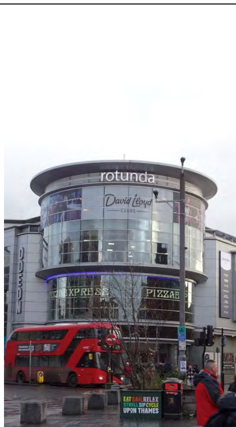
Kingston station 一出站。