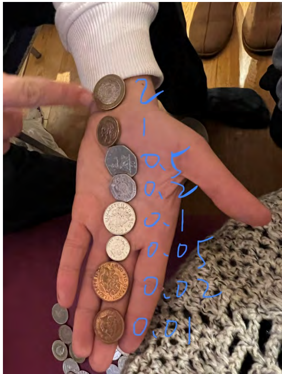
(照片簡要說明)英鎊真得分很多錢