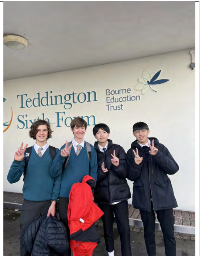
(照片簡要說明) 這是我與我的學伴(紅外套)一起所拍的合照