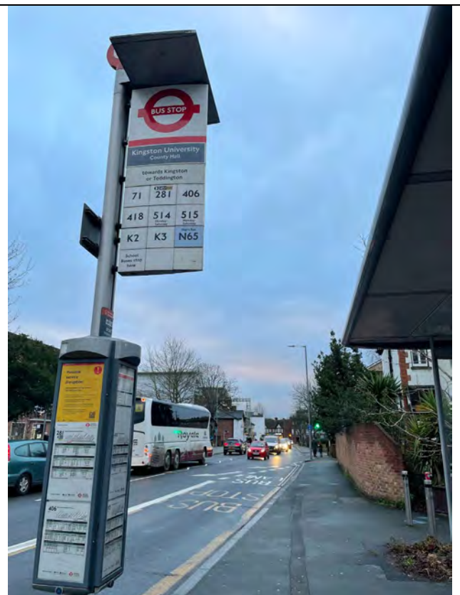
(照片簡要說明) 這是上學每天都要轉車的地方