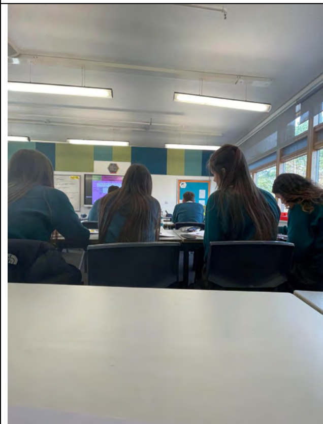
(照片簡要說明) 這是他們上課的樣子