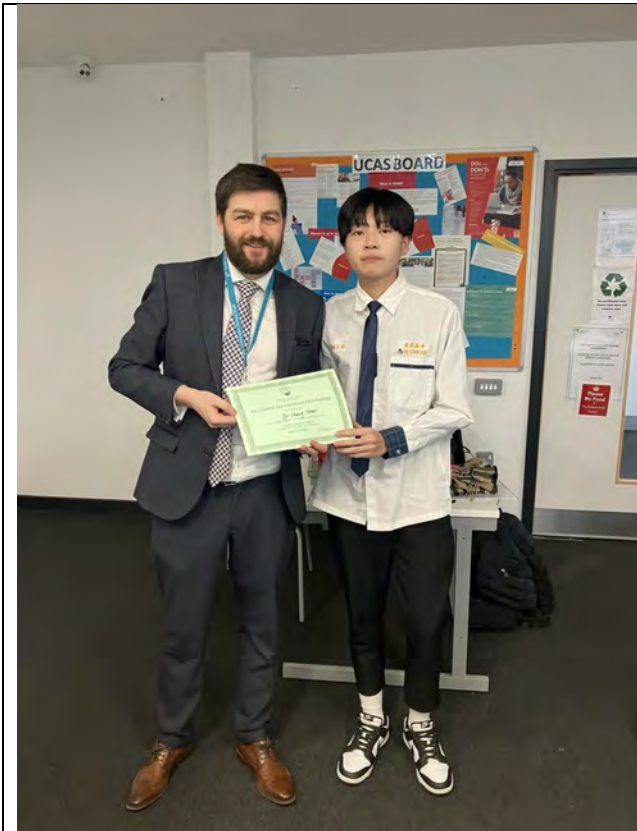
(照片簡要說明) 這是最後一天結業式發證書所拍的照片