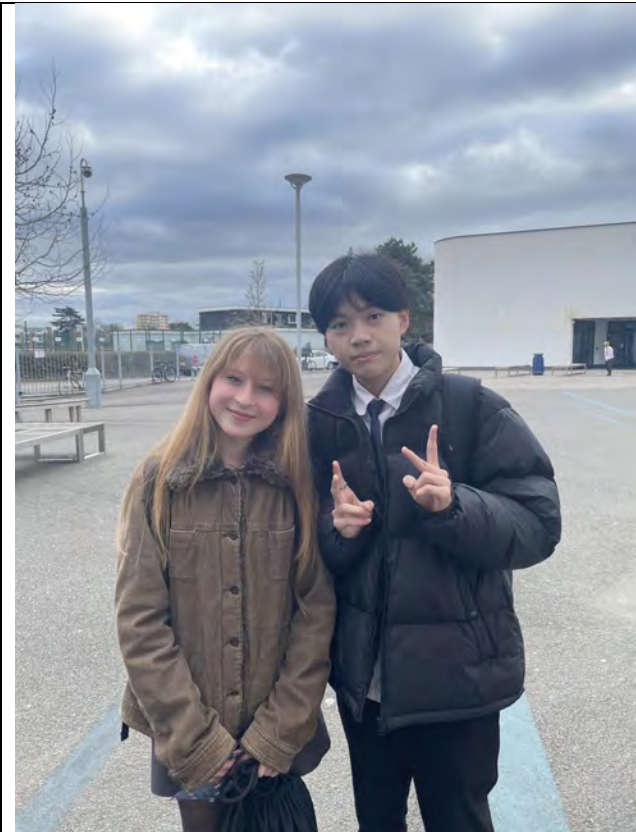
(照片簡要說明) 這是某一天上法文課所認識的外國學生