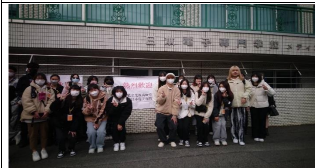
電子專門學校第一天