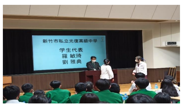
日本專門學校課程閉幕儀式