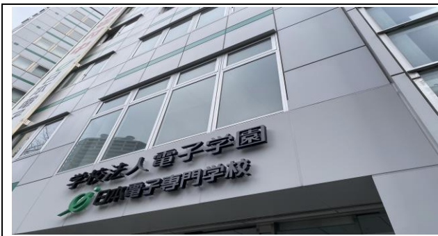
日本電子專門學校門口