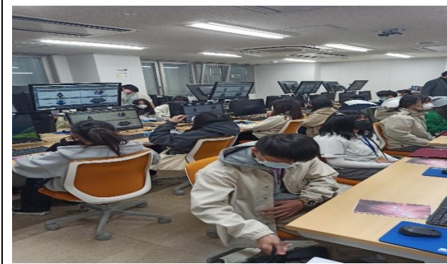
第一次 CG 製作課程