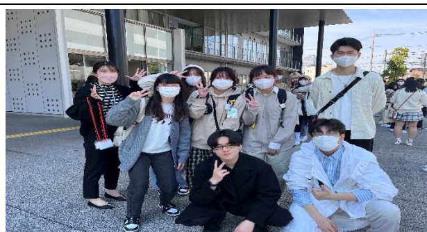
離開 iU 大學前和大學生們拍照