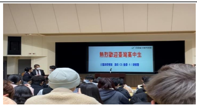
電子專門學校第一天發表