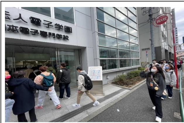
第三天去電子專門學校上課