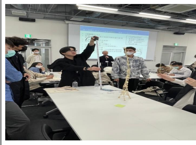
利用麵條及膠帶製作出最高的塔