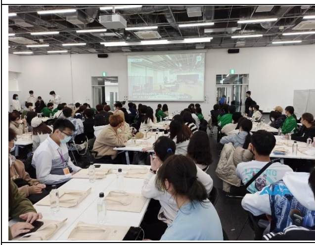
聽他們學校的介紹