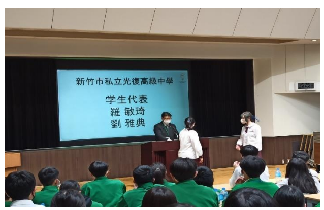
電子專門學校致詞