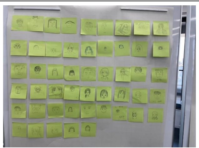
了解自己在別人眼中的樣子