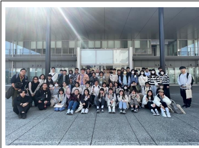
到 iu 大學參訪