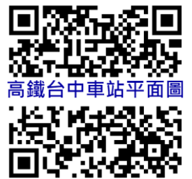
高鐵台中車站平面圖