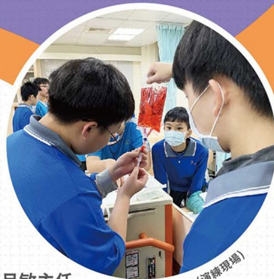
藥物抽取(演練現場)