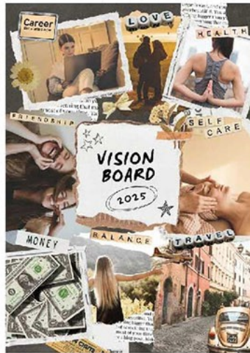
夢想覺知(夢想板範例)