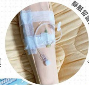
靜脈留置針(模型示範圖)