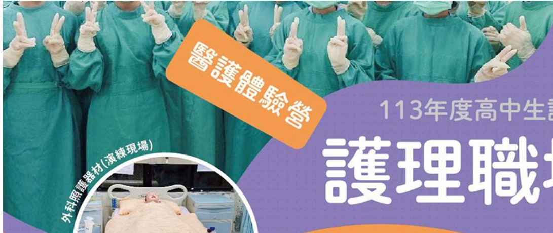
外科照護器材(演練現場)