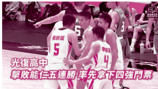
光復高中 擊敗能仁五連勝 率先拿下四強門票