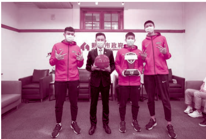
（轉載自：自由時報新聞）2021/03/17 13:44

〔記者蔡彰盛／竹市報導〕新竹市光復高中在今年 HBL 勇奪季軍，創下桃竹苗地區最佳成績，更是竹市首座季軍獎盃，市長林智堅除了到場觀賽，今特地邀請全體球員到市府會面，互贈籃球與球衣，並與球員們暢聊最後一場賽事緊張的過程。叱吒球場的「雙勝」陳將雙、莊朝勝分享一路打進四強賽的心情，總教練陳定杰則誓言「有一天會拿冠軍」！