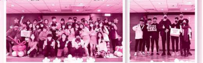
110年英語文成效甄洋經典歌曲競賽

也會為了歌曲而集體合作設計服裝、舞蹈、自彈自唱，認真投入的自主學習態度，宛如參加一場奧運比賽嘉年華。