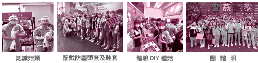
認識菇類 配戴防塵頭套及鞋套 體驗DIY種菇 團體照