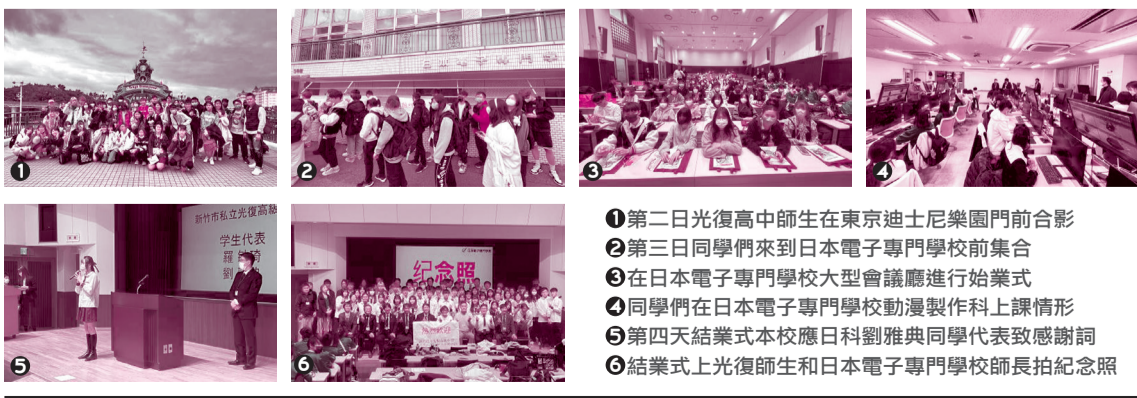
1 第二日光復高中師生於東京迪士尼樂園門前合影 2 第三日同學們來到日本電子專門學校前集合 3 在日本電子專門學校大型會議廳進行始業式 4 同學們在日本電子專門學校動漫製作科上課情形 5 第四日結業式本校應用日語科劉雅典同學代表致感謝詞 6 結業式上光復師生和日本電子專門學校師生拍紀念照

本校和日本友好協定校日本電子專門學校合作辦理動漫技能實習國際教育旅行，辦理期間自 112 年 3 月 12 日(星期日)至 112 年 3 月 17 日(星期五)，共 6 天五夜，參加學生 50 名，隨團老師 3 名，旅行社領隊 3 人。日本電子專門學校為此次研習開設的課程有：(一) 動漫製作體驗課程、(二) 遊戲製作體驗課程、(三) CG 影像體驗課程、(四) AI 人工智慧體驗課程，同學們於出國前報名時即選擇自己所喜歡的課程去體驗，分組上課。結業式上，本校由應用英語科羅敏琦同學代表上台領結業證書、應用日語科劉雅典同學用日語代表致謝辭，贏得滿堂熱烈掌聲。日本電子專門學校另安排一天參訪該校位於東京都墨田區之 iU 情報經營創新專門大學及體驗該校課程，透過參訪及學習活動，讓同學們了解日本專門職業教育的訓練方式與知識領域。