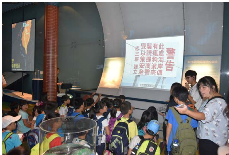
海科館海洋環境廳有關瘋狗浪的展項。